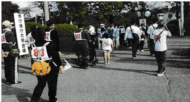
大人も子どもも和やかに“歩け歩け”

自治会、地区自治会連合会、野田市の各行事や活動がコロナで中止、縮小。そんな中、西三ケ尾自治会の見守り隊は毎日朝夕学童のお世話を、白鷺梅郷住宅自治会のウォーキングパトロールは独自に毎週防犯活動を行っている。