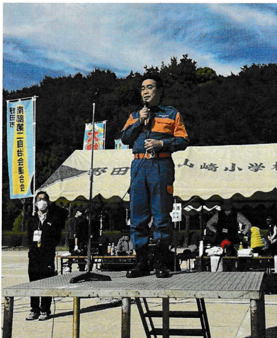
市の防災訓練終了後、南部第2地区の オータムフェスタにかけつけた鈴木市長