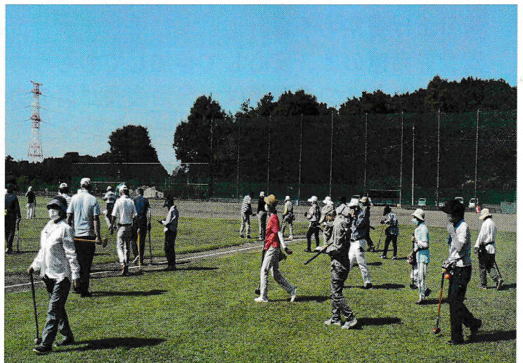
福田地区のグラウンドゴルフ大会“さあ、やるぞ！”